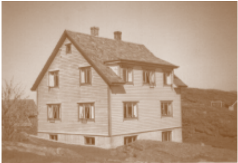
«Det blei betre plass då nyehuset var ferdig.»

Dei hadde alltid nok mat, men far min fortalde at om haustkveldane var det mange gonger dei ikkje åt kvelds før dei hadde vore med sjøen og kasta mort. Då var det mort og småpoteter som var kveldsmaten. Ungane las for maten på omgang og det var ingen som fekk begynna å eta før det var gjort, og då delte bestemor ut maten, vanlegvis to skiver og ei potetkake til kvar.